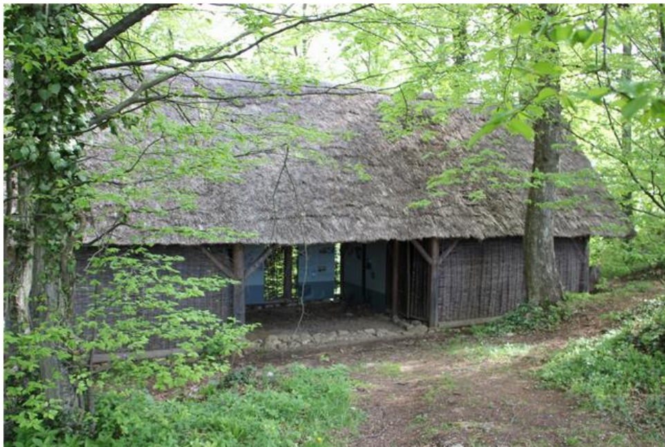
Fotografija 8: Firina hiška

Zgodba o deklici Firi je izmišljena zgodba, ki je zapisana je kot del predstavitve arheološkega najdišča Rifnik. Na vrhu hriba obstaja tudi Firina hiška, v kateri je na panojih predstavljena zgodovina Rifnika.