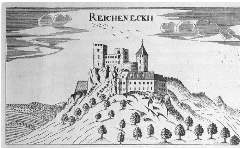
Fotografija 6: Vischerjeva topografija gradu

Na severni strani Rifnika, na pobočju pod vrhom hriba se nahajajo razvaline grajskega stolpa, ob katerem stoji grad Rifnik. Grad se prvič omenja leta 1326. Takrat je dobil Viljem Vrbovški stolp pri Rifniku.