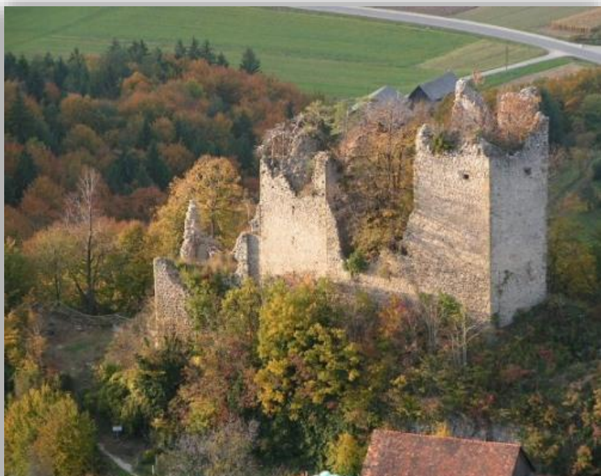
Fotografija 7: Pogled na razvaline gradu Rifnik

Domnevno so grad razrušili uporni kmetje leta 1635, v 2. polovici 17. stoletja pa naj bi že bil razvalina. Grad je že v romanski dobi dobil svoj značilni tloris – potegnjen pravokotnik. Obsegal je trinadstropni pravokotni stolp na zahodni strani, za njim pa se je razprostiralo obzidano peterokotno dvorišče. To zasnovo so že v zgodnji gotski dobi dopolnili z novim stolpom peterokotnega tlorisa v vzhodnem delu dvorišča. Ta stolp je še danes ohranjen do višine treh nadstropij in ima gotska okna z obstenskimi sedeži ter okvire s prirezanimi robovi. V zahodni steni je okrnjen šilastoločen gotski portal s prirezanimi robovi. Sočasno je bil na mestu nekdanjega dvorišča pozidan palas. Grajsko zasnovo so povečali v 16. stoletju s peterokotnim oborom ter predgradjem. Razvaline gradu z ohranjenim prvotnim stolpom imajo poleg umetnostno-zgodovinske vrednosti tudi pomembno vedutno vrednost. 2