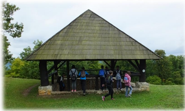
Fotografija 5: Vodni zbiralnik na Rifniku

Življenje na Rifniku je tudi danes kar živahno. Poleg domačinov, se nanj povzpne vedno več obiskovalcev, ki želijo videti, kako je bilo tukaj pred dawnimi časi. Območje je namreč urejeno v lep arheološki park, z obnovljenimi temelji poznoantične vasi z obzidjem s stražarnicami, vodnim zbiralnikom, v katerega se je stekala voda iz streh cerkve, tlorisi sedmih hiš in dveh starokrščanskih cerkva. Veliko je tudi arheologov, ki še vedno kopljejo po preteklosti in želijo iz nje izbrskati koščke informacij, ki bi jim pomagali pri razumevanju življenja pred več tisoč leti. 1