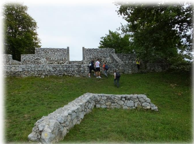
Fotografija 4: Ostanki starokrščanske cerkve

Po obdobju mirnega življenja so v pozni antiki časi znova postali nevarni in ljudje so se spet umaknili na Rifnik, ki jim je še vedno nudil zaščito. Ker pa so bili tudi vsiljivci vedno bolj opremljeni, zgolj naravna zaščita ni več zadostovala, zato so celotno naselbino na južnem in zahodnem pobočju zaščitili z mogočnim, meter debelim obzidjem, grajenim iz lomljenega apnenca in vezanim z malto. Kot prejšnji, so tudi novi naseljenci s sabo pripeljali novega boga, ki so mu sezidali cerkev in v kateri so ga častili. Na Rifniku se pojavi krščanstvo. Na najvišji točki so postavili zgodnjekrščansko cerkev, ki je imela preprosto pravokotno zasnovo. Zgrajena je bila verjetno na začetku 6. stoletja. Kasneje so ji prizidali še vhodno lopo in stranski vhod s krstilnico.