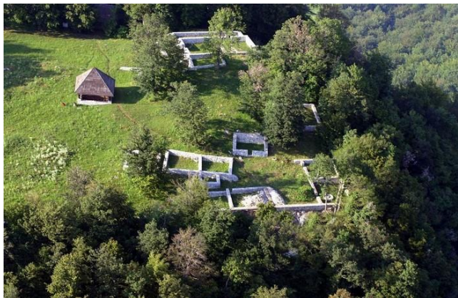
Fotografija 1: Zračni posnetek vrha Rifnika

Rifnik je 568 m visok hrib, ki je naravno odlično zavarovan in se dviga nad Šentjurjem. Zaradi ugodne lege je bil poseljen v več zgodovinskih obdobjih. Najstarejši sledovi segajo v čas bakrene dobe, obljuden je bil tudi v pozni bronasti, železni in rimski dobi.