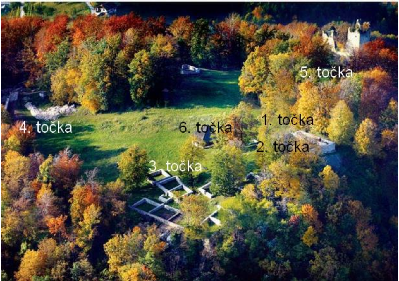
Fotografija 10: Pogled na vrh Rifnika, z označenimi točkami, kjer bodo potekale delavnice