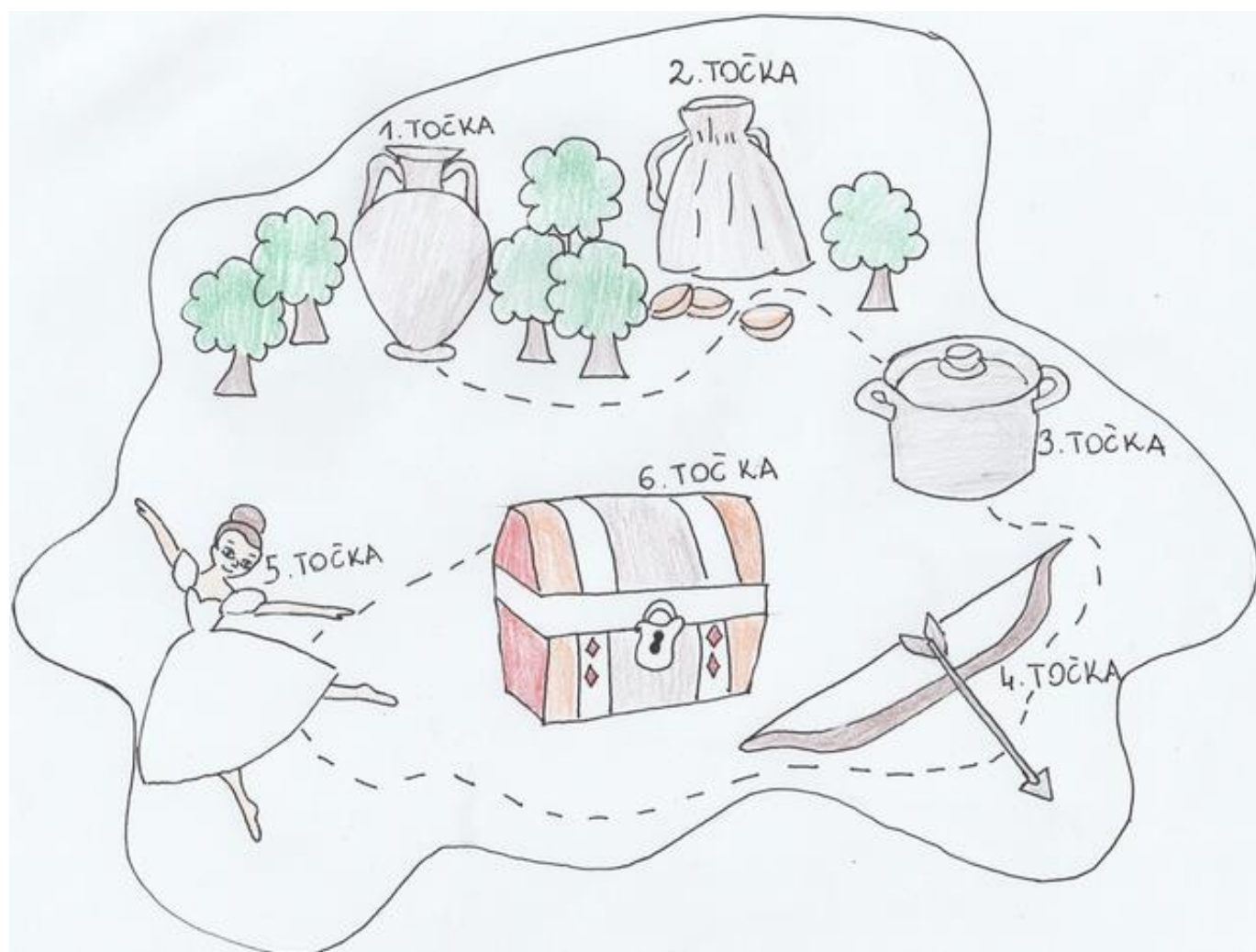
Fotografija 9: Skica prostora in umestitev posameznih delavnic

Pripravili bomo še odeje, na katerih bodo obiskovalci lahko posedeli, ko si bodo ogledali igro oziroma, če si bodo želeli malo odpočiti.