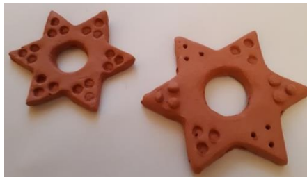
Fotografije 11, 12, 13: Izdelki, ki jih bomo izdelovali v prvi delavnici