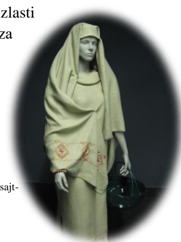
Fotografija 3: Oblačila v prazgodovini

Preživljali so se z lovom in v dolini lovili ribe. Obdelovali so polja, sejali so zlasti žito. Imeli so tudi živino, predvsem drobnico. Sami so si tkali blago za oblačila, ki so jih nato ukrojili.